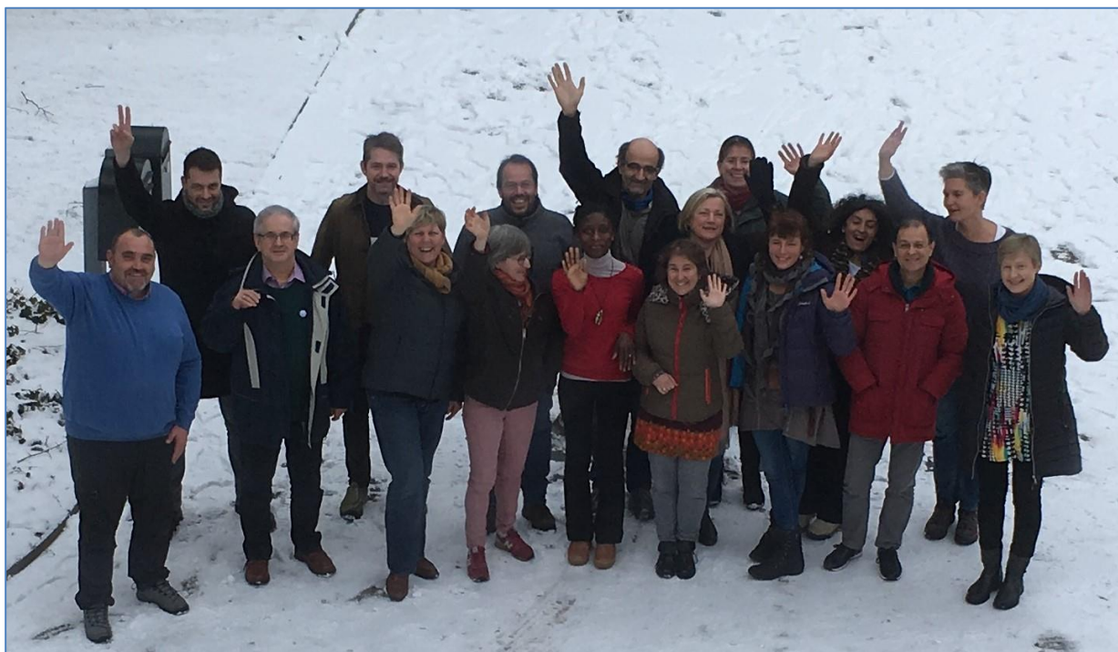
Het Teacheesy team

Het Teacheesy programma is officieel geëindigd op 31 augustus 2019. Voor ons het moment om Erasmus+ te bedanken voor de financiering en om stakeholders en lezers van deze nieuwsbrief te bedanken voor hun betrokkenheid bij dit project. Wij hebben met veel plezier aan het Teacheesy project gewerkt. Vanwege de interessante en belangrijke inhoud en daarnaast omdat het ons onderling begrip en ons enthousiasme om actief en nuttig te zijn in dit werkveld van de Europese boeren- en ambachtelijke kaas- en zuivelproductie verder heeft vergroot.