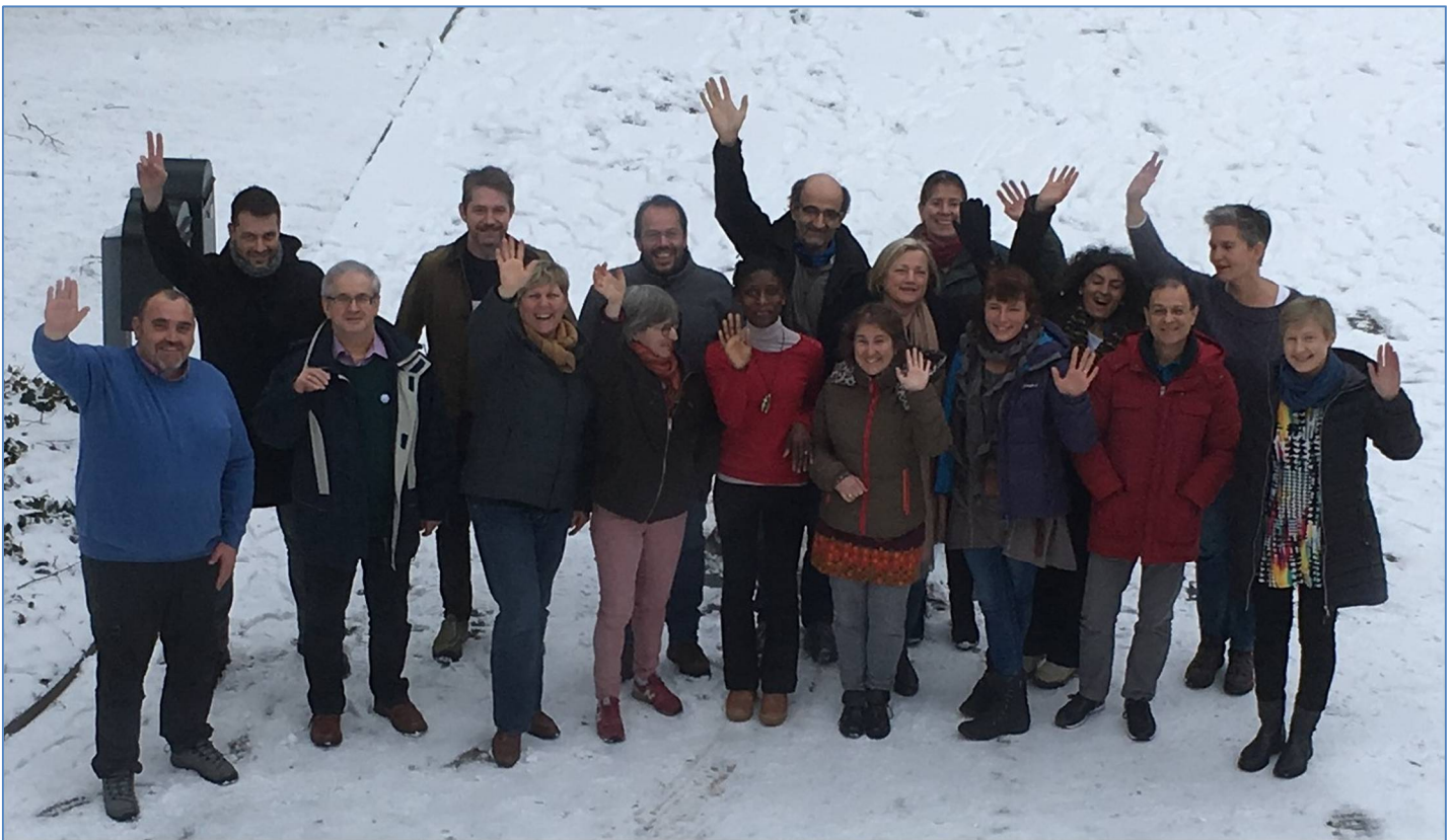
Екипът на проект Teacheesy

Проектът Teacheesy приключва на 31 август 2019 г. Време е да изкажем благодарността си на програма Еразъм за финансирането и на всички редактори и заинтересовани страни, които участваха в работата на проекта. Наистина ни беше приятно да работим по проекта Teacheesy поради неговото интересно и важно съдържание и освен това, защото той разшири взаимното ни разбиране и ентусиазма ни да бъдем активни и полезни за европейските фермери и занаятчии - производители на сирене и млечни продукти.