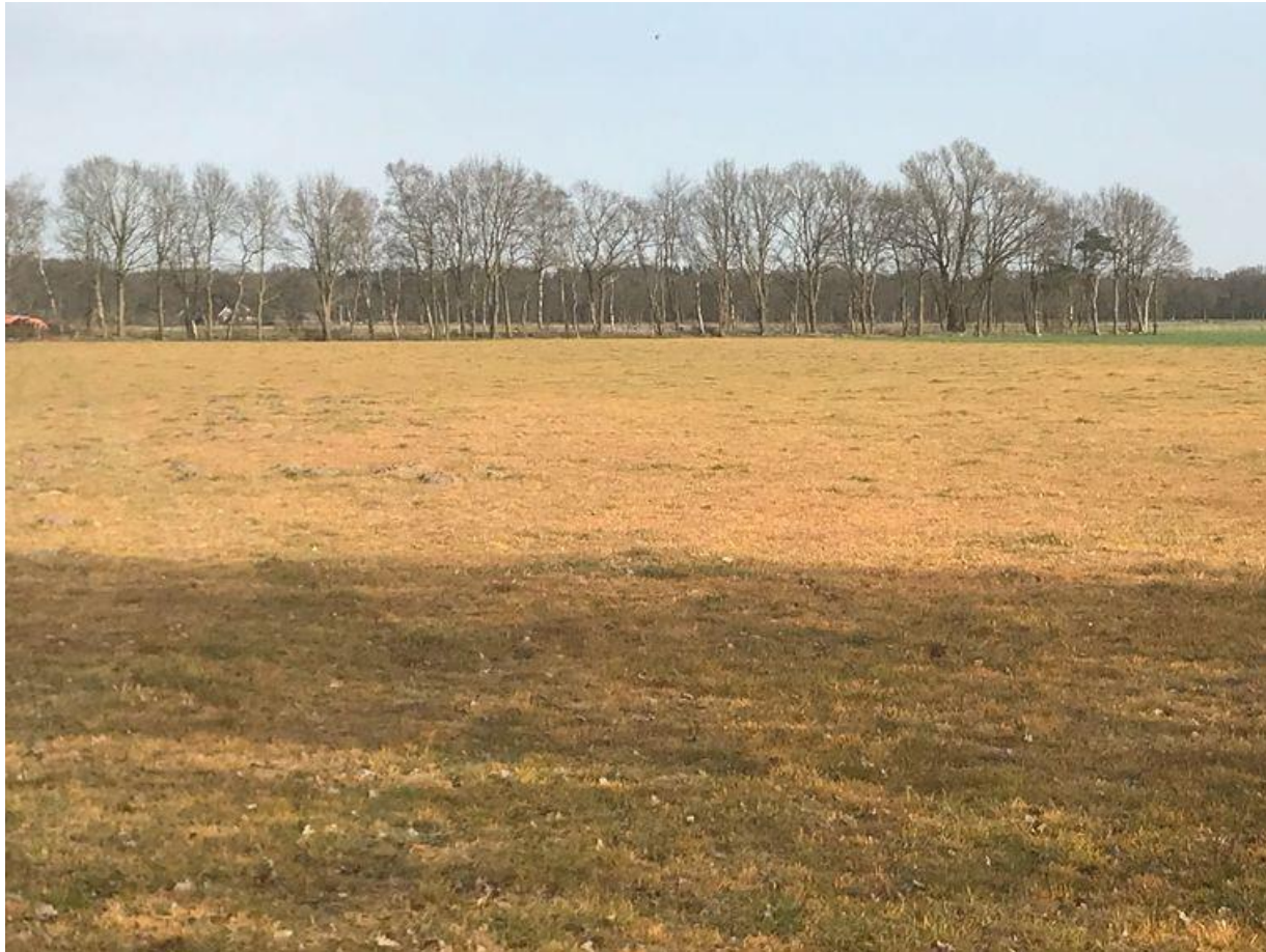
Vir: Jan Overesch